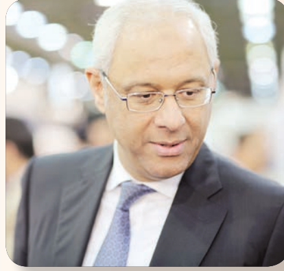
السفير المصري ياسر عاطف

فالإبداع في مصر يتاح أمام القارئ في الكويت، وفي الكويت يتاح الإبداع من باقي الدول العربية ويحصل نوع من تبادل الأفكار ما بين الأدباء والمبدعين، ويكون هناك نوع من التفاهم وتعزيز التعاون أكثر ما بين كل الدول العربية». واختتم السفير ياسر عاطف بتأكيد أنه التعاون الثقافي بين مصر والكويت يحظى باهتمام كبير على كافة المستويات سواء من خلال تبادل الإصدارات المشتركة، وجود كثير من الكتب المصرية التي تطبع حتى لكتاب مصريين مقيمين في الكويت أو غير مقيمين في الكويت تطبع عن طريق دور النشر الكويتية، مشيراً إلى أن دور النشر الكويتية لها نشاط كبير في مجال النشر وإصدار الكتب والروايات وكل أنواع الكتب المتاحة.