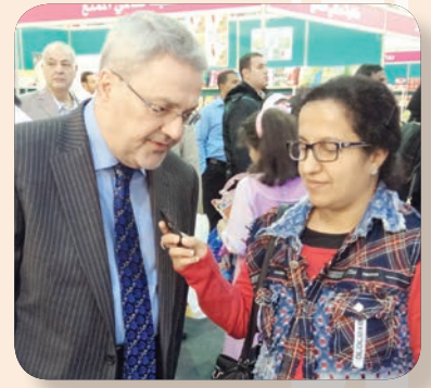
السفير العراقي متحدثا لنشرة المعرض

وصف السفير العراقي لدى الكويت محمد حسين بحر العلوم معرض الكويت للكتاب بأنه من الفعاليات السنوية المهمة في دولة الكويت، وفي المنطقة، والتي يقوم بها المجلس الوطني للثقافة والفنون والآداب. ويعد المعرض بمثابة المسرح لعرض الإنتاجات الثقافية الأدبية والعلمية في الكويت والمنطقة، وتكون متاحة لكل أفراد المجتمع للاطلاع علي