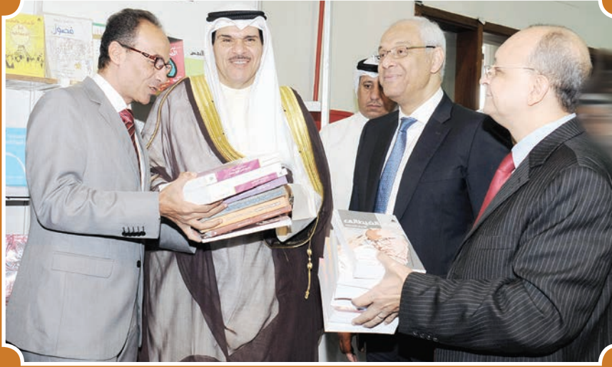
وزير الإعلام والسفير المصري في أحد الأجنحة المصرية