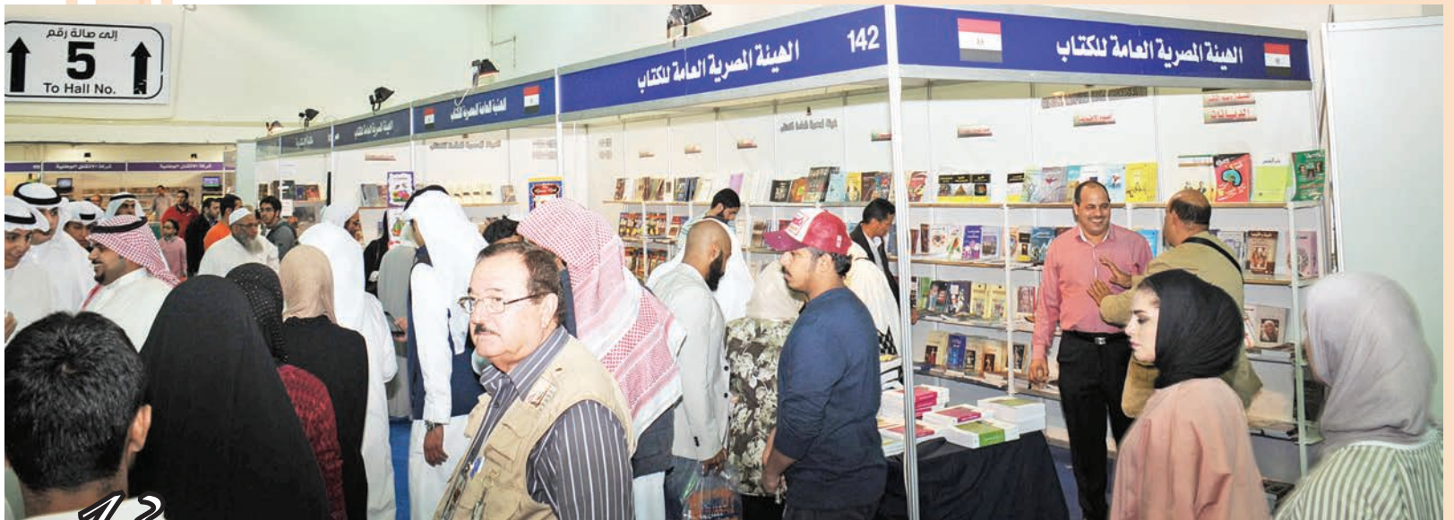
إقبال ملحوظ على جناح الهيئة المصرية للكتاب

180 عنواناً جديداً، التخصص الأكبر في القانون والفلسفة والتربية وعلم النفس.